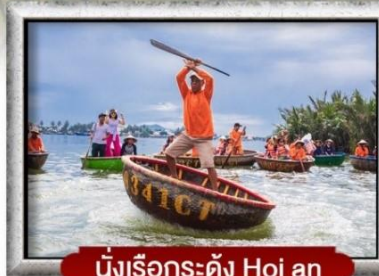
นั่งเรือกระดิง Hoi an