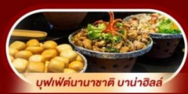
บุฟเฟ่ต์นานาชาติ บานาฮิลล์